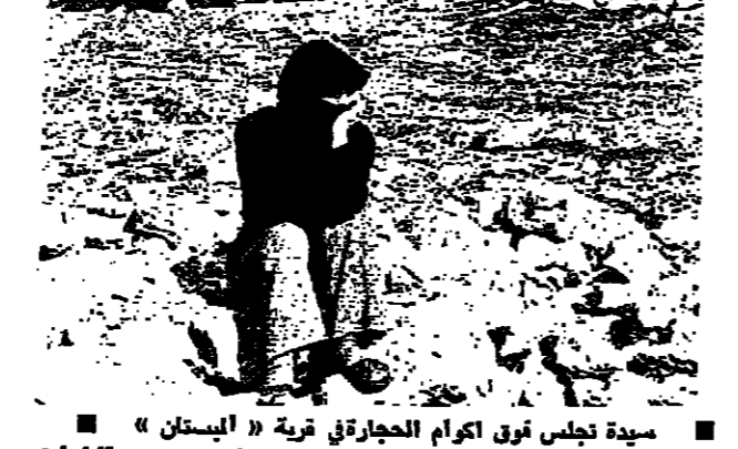
سيدة تجلس فوق اكوام الحجارة في قرية «البيستان»